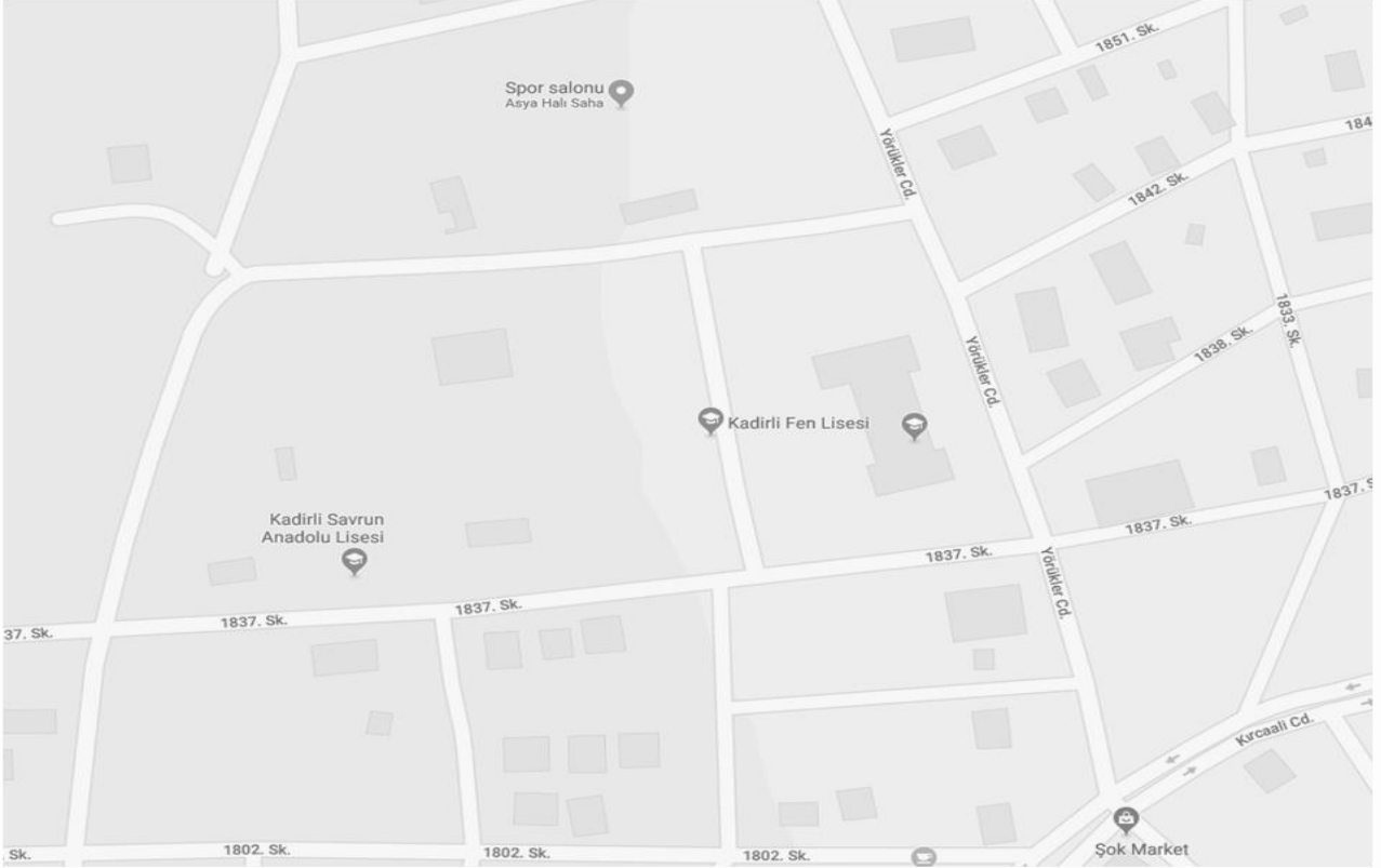
Okul Haritası -Kroki

Şehit Muhammet Mustafa Karabörk Fen Lisesi 2010 -2011 Eğitim Öğretim yılında Kadirli Şehit Halis Şişman Mahallesiinde Mehmet Nuri Arıoğlu tarafından yaptırılan İlköğretim Okulu binasında hizmete açılmıştır. 2013-2014 Eğitim Öğretim yılında Şehit Kansu Küçükateş mahallesiinde yapılan kendi binasına taşınmıştır. Okulumuzda 4 idareci, 35 Öğretmen, 1 memur ,2 kadrolu aşçı, 8 yardımcı personel ve 504 öğrenci bulunmaktadır. Okulumuz 11000 m 2 alan üzerine kurulmuş, 100 er kişilik kız ve erkek öğrenci pansiyonu, kapalı ve açık spor tesisleri, ve merkezi ısıtma sistemi bulunan bir eğitim kompleksidir.